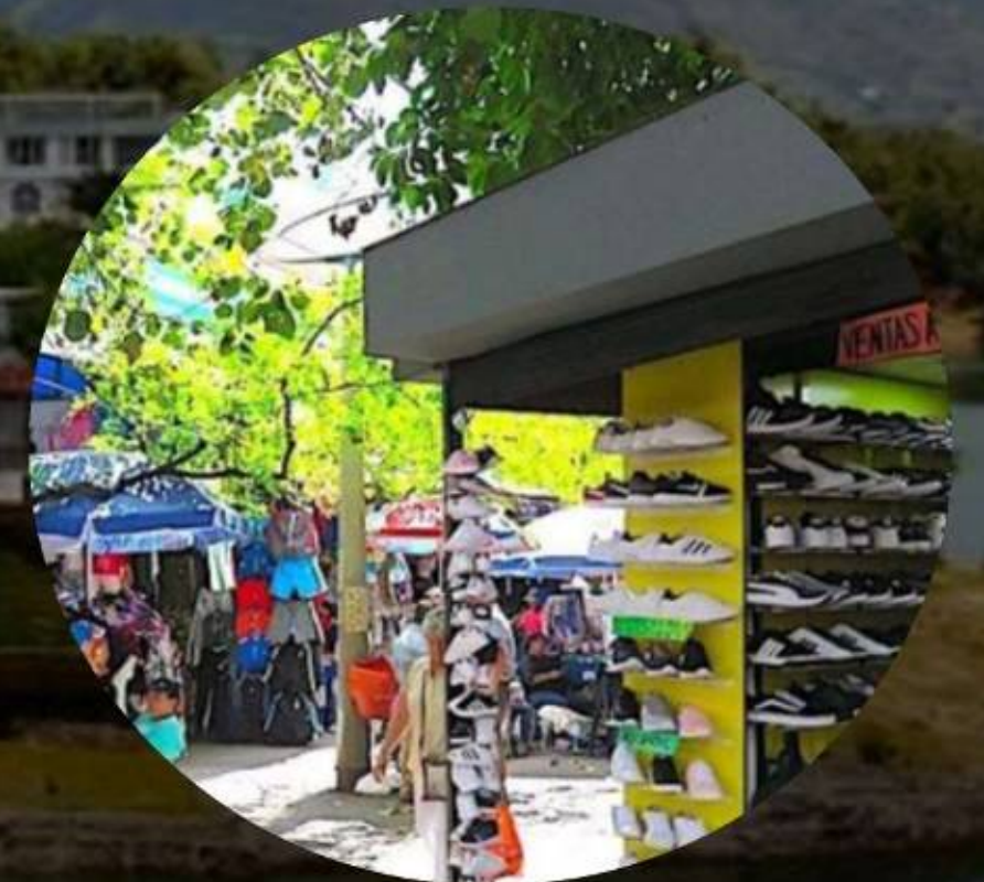
TOUR DE COMPRAS