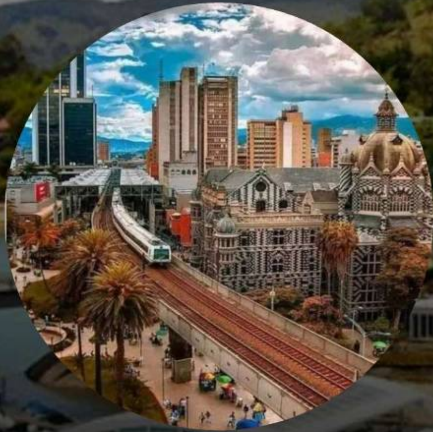
TOUR POR LA CIUDAD