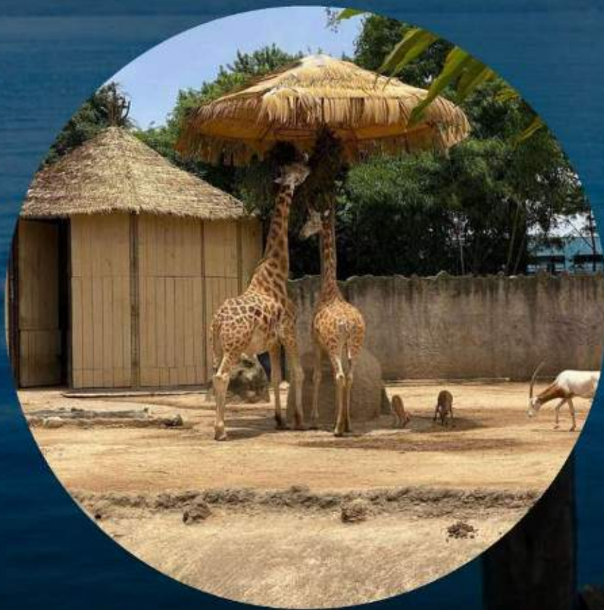
ZOÓLOGICO LA AURORA