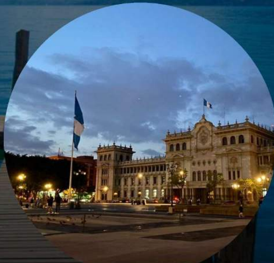
CIUDAD DE GUATEMALA