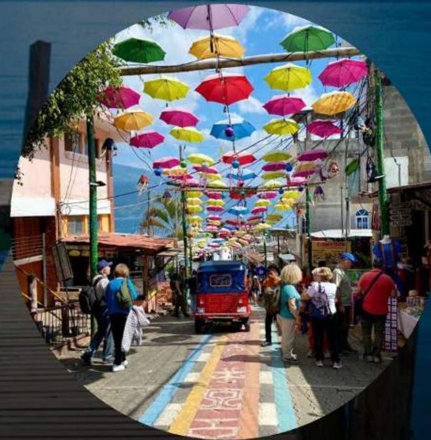
SAN JUAN LA LAGUNA