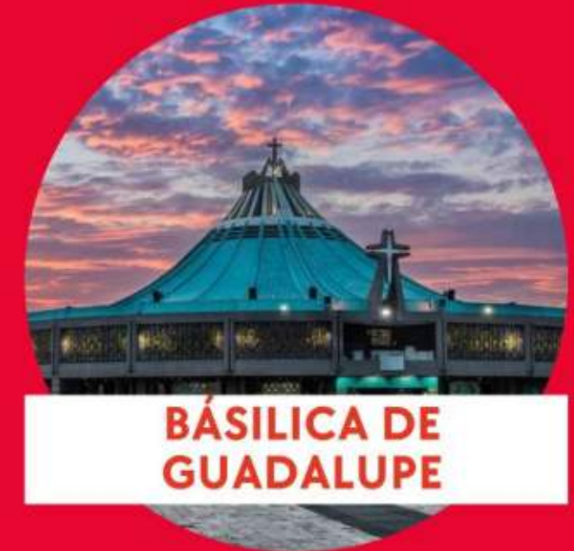
BÁSILICA DE GUADALUPE