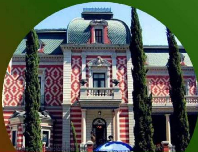
MUSEO DE CERA