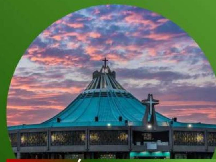
BÁSILICA DE GUADALUPE