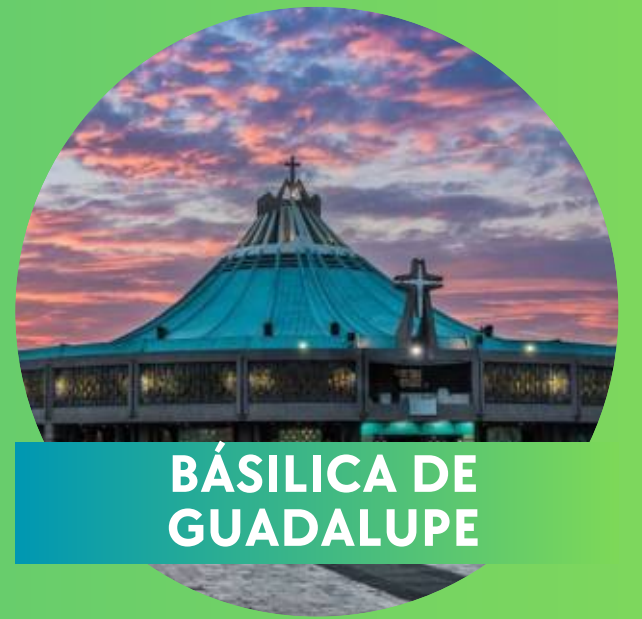
BÁSILICA DE GUADALUPE