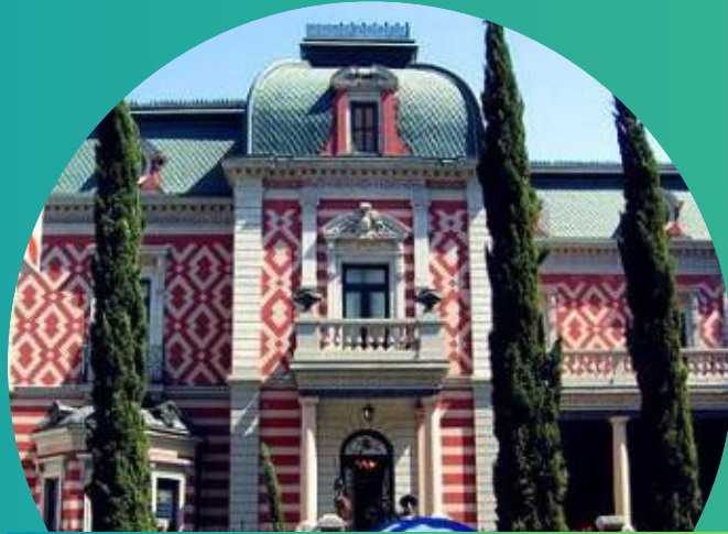
MUSEO DE CERA