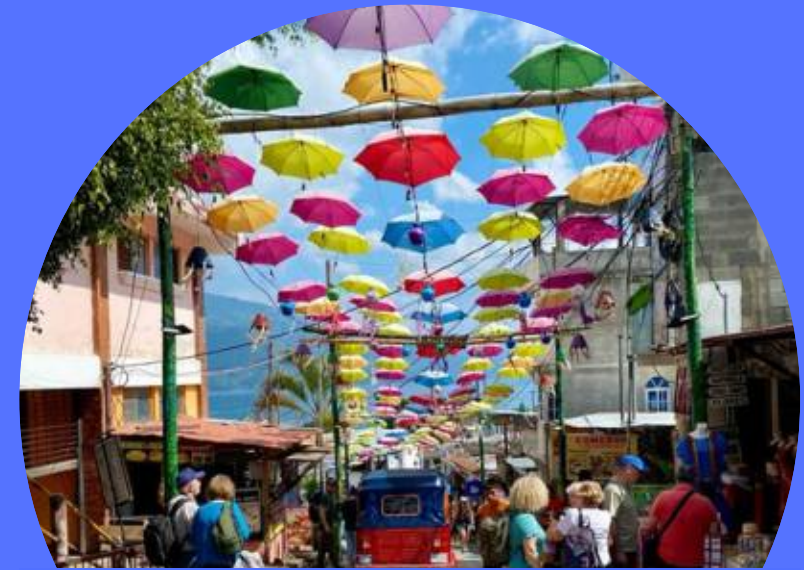
SAN JUAN, LA LAGUNA