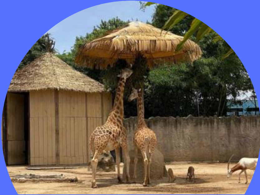
ZOOLOGICO LA AURORA