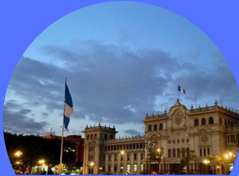
CIUDAD DE GUATEMALA