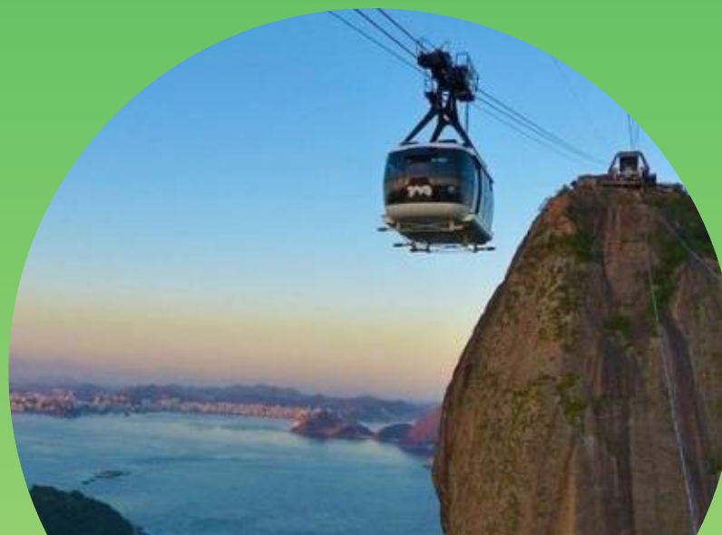
PAN DE AZÚCAR