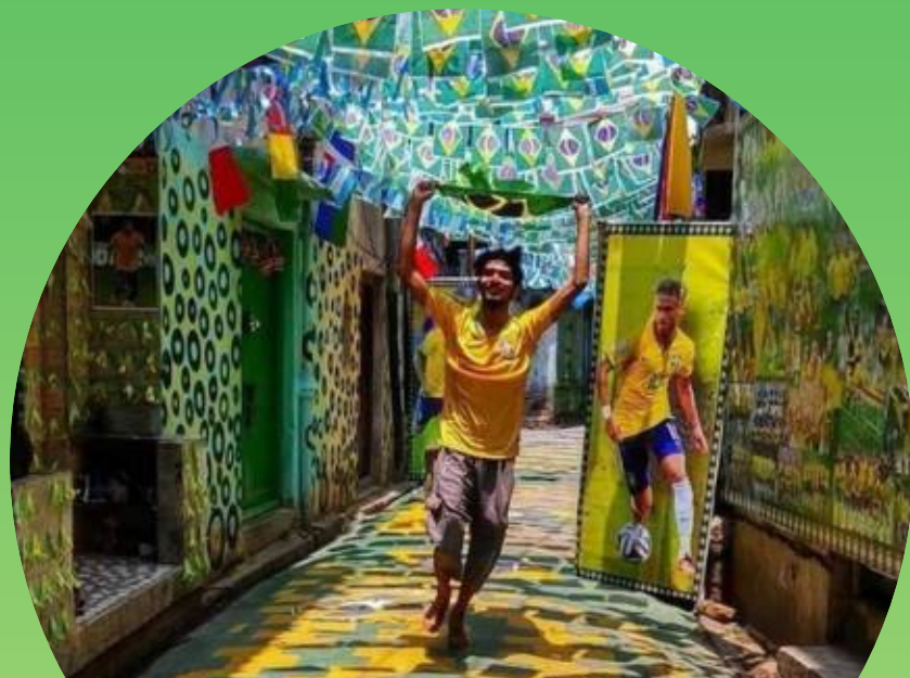
RÍO DE JANEIRO